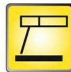
Ø 1,6 - 2,4 mm